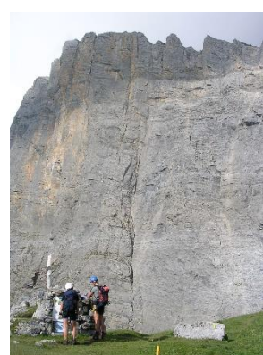
Via ferrata du Daubenhorn